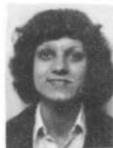
Adosinda 3º Direito