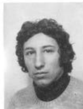
Rui Café 4º Germânicas Trab. - est.