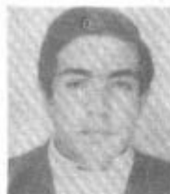
Morgado 5º Eng. Civil