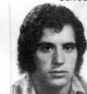
LIMA 2º ano ECONOMIA