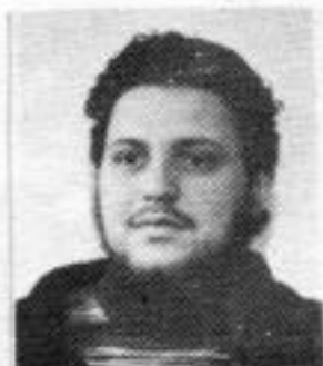
VERÍSSIMO 1º ano HISTÓRIA