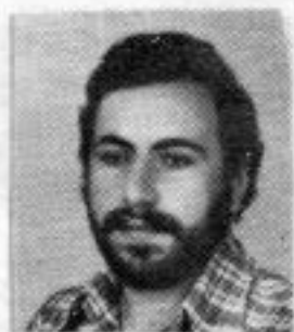
BAÍA 4º ano DIREITO