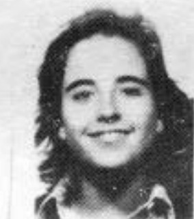
SÃO FERNANDES 4º ano MEDICINA