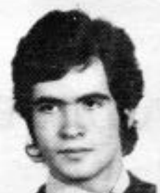
TÓ LAMEGO 2º ano DIREITO