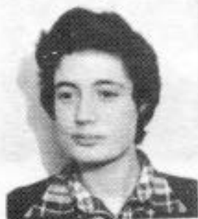
LUZIA 5º ano DIREITO