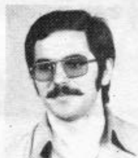
BOAVISTA 2º ano BIOMÉDICO O