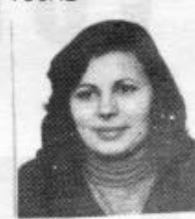
BENILDE 2º ano ISSSC