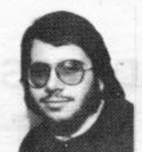
ABRANCHES 1º ano ECONOMIA