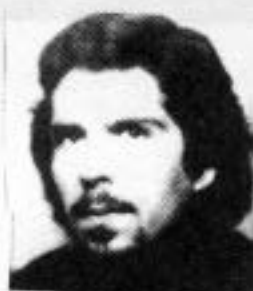
Machado 3º E.