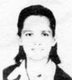
São Fraga-39 M