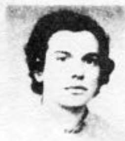
Pinto da Cunha-39 E