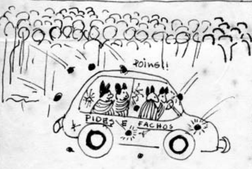
3.º "FORTÍSSIMO COM PEDRAS"