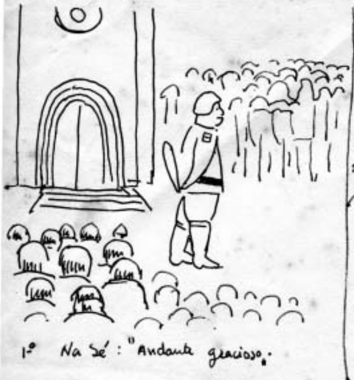
1.º Na Sé: "Andante gracioso."